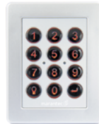
Digital 525 Funk-Codetaster