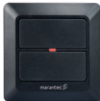
Digital 520 Wandtaster